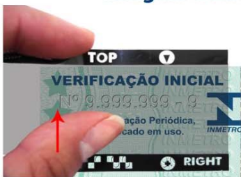
Imagem Oculta anti-cópia

Elemento gráfico oculto. A imagem não pode ser visualizada a olho nu nem com o auxílio de equipamento como lentes de aumento ou microscópio, podendo somente ser visualizada por meio de leitor de plástico transparente.