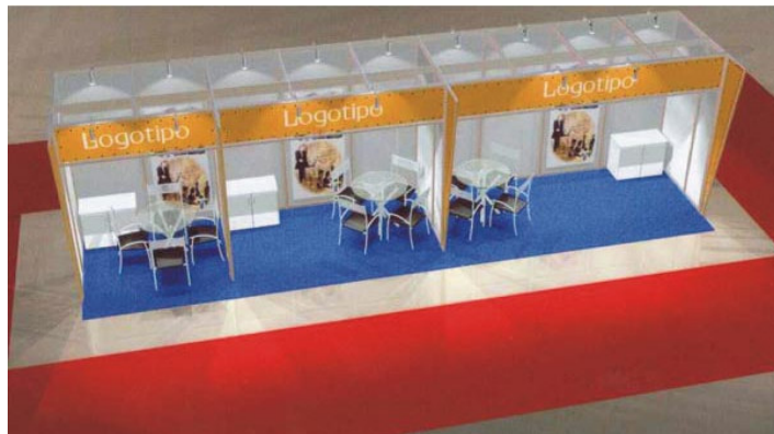
Fig. 2 - Perspectiva superior dos stands ofertados aos expositores do ISHM 2006