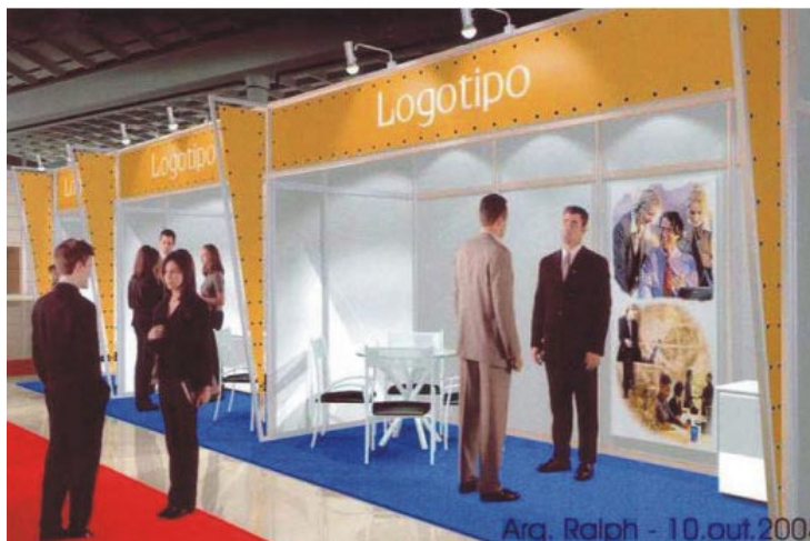
Fig. 3 - Perspectiva frontal dos stands ofertados aos expositores