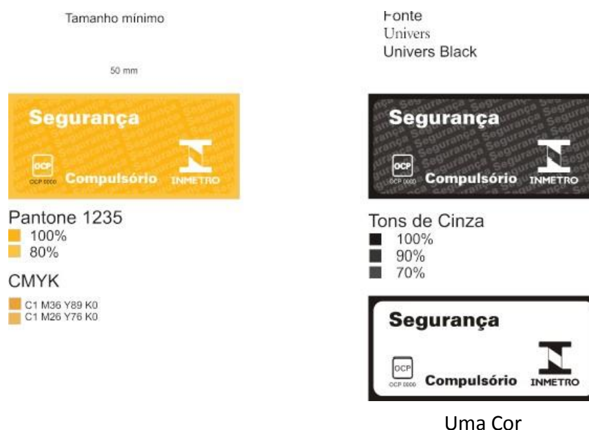
Figura 1 - Selo de Identificação da Conformidade (Selo).

Nota 2: Na Figura 2 o termo “uma cor” não define qual deve ser utilizada, podendo prevalecer aquela da embalagem. As inscrições e as marcas representadas na cor preta podem adotar a cor da própria embalagem.