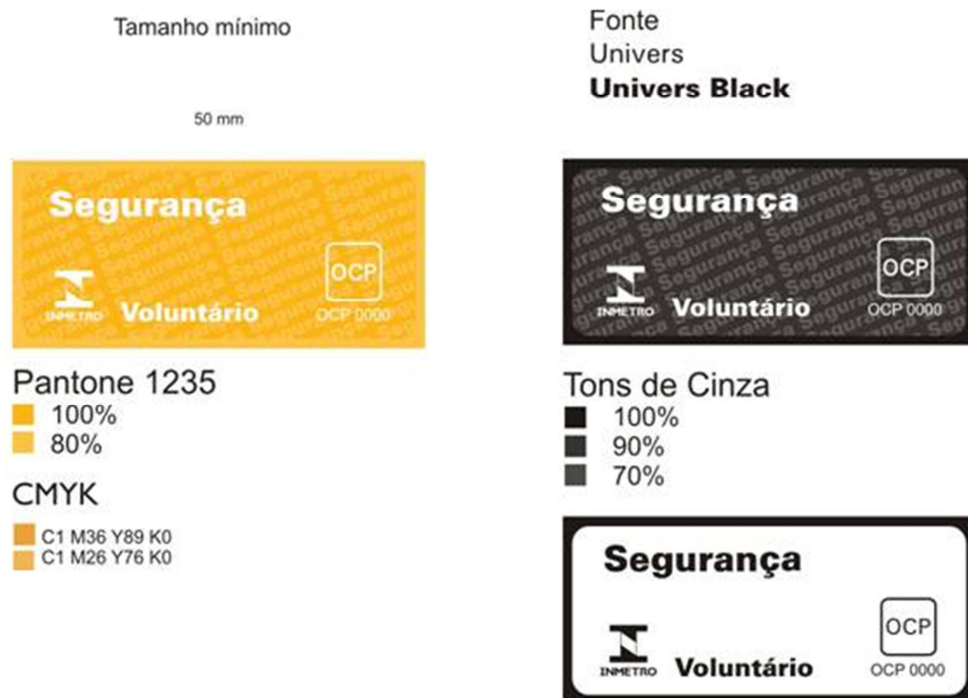
Figura 2 - Selo de Identificação da Conformidade para produtos com certificação voluntária