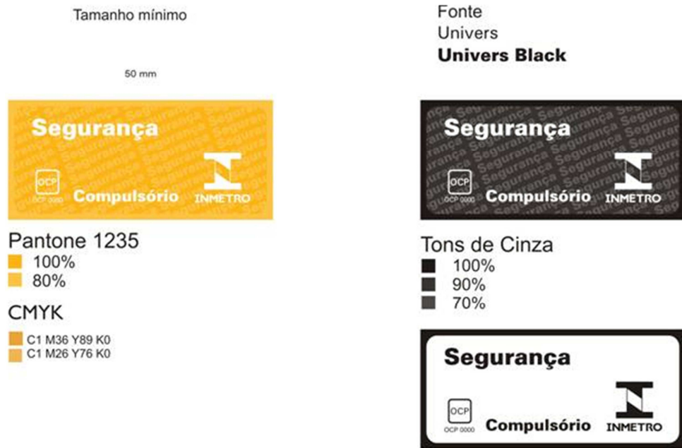
Figura 1 - Selo de Identificação da Conformidade para produtos com certificação compulsória