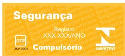
Figura A.1 – Formato e dimensões do Selo de Identificação da Conformidade.

A.2 Para os utensílios que possuam revestimentos deve ser utilizado o Selo de Identificação da Conformidade conforme a figura A.2, devendo ser apostado no rótulo na embalagem de forma impressa ou de adesivo, de forma clara, visível ao consumidor para sua decisão de compra.