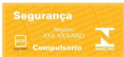
Figura A.1 – Formato e dimensões do Selo de Identificação da Conformidade.

A.2 Para os utensílios que possuam revestimentos deve ser utilizado o Selo de Identificação da Conformidade conforme a figura A.2, devendo ser apostado no rótulo na embalagem de forma impressa ou de adesivo, de forma clara, visível ao consumidor para sua decisão de compra.