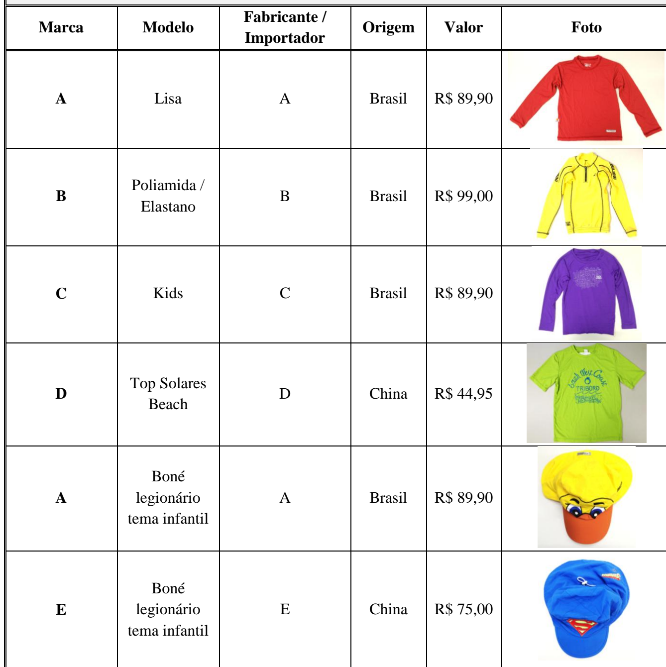
Tabela 1 – Marcas de Roupas com Proteção UV de Uso Infantil