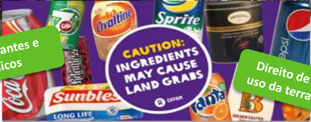
CAUTION: INGREDIENTS MAY CAUSE LAND GRABS