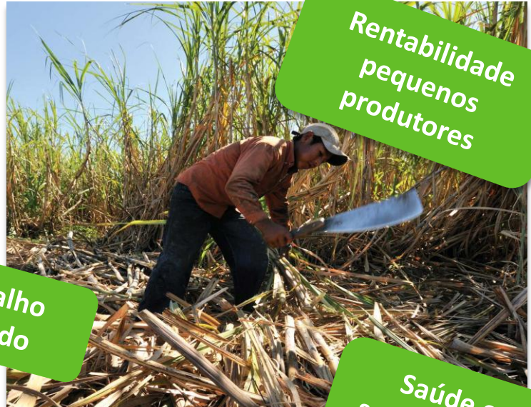
Rentabilidade pequenos produtores